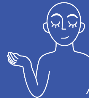
ACCUEIL DE JOUR